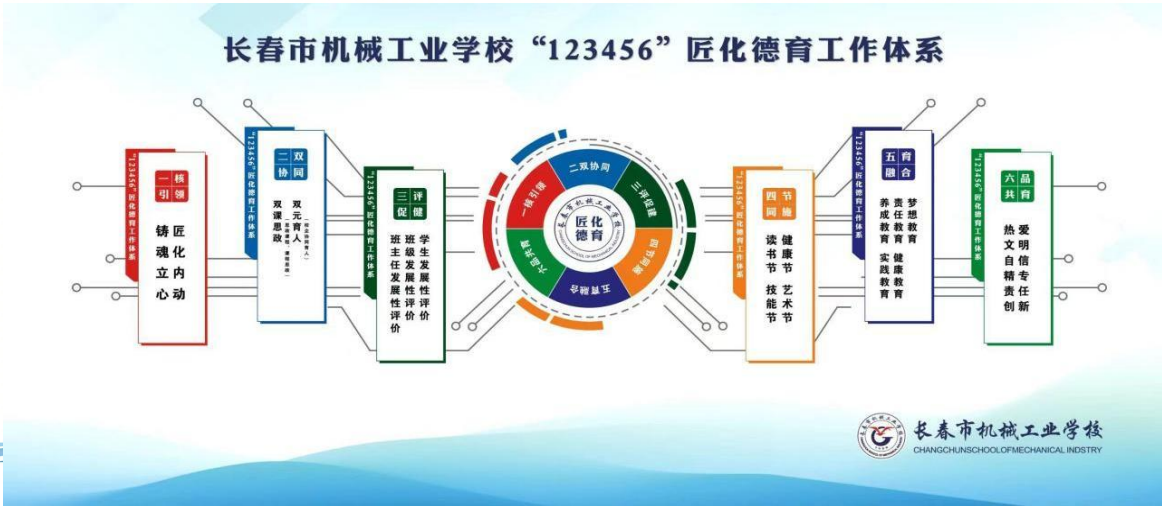
图2-1 学校“123456”思想政治工作体系图

长春市机械工业学校立足“123456”思想政治工作体系，创新构建以“读书节、技能节、健康节、艺术节”为核心载体的四节联动育人平台，系统推进五育融合，形成了特色鲜明的主题教育活动体系。