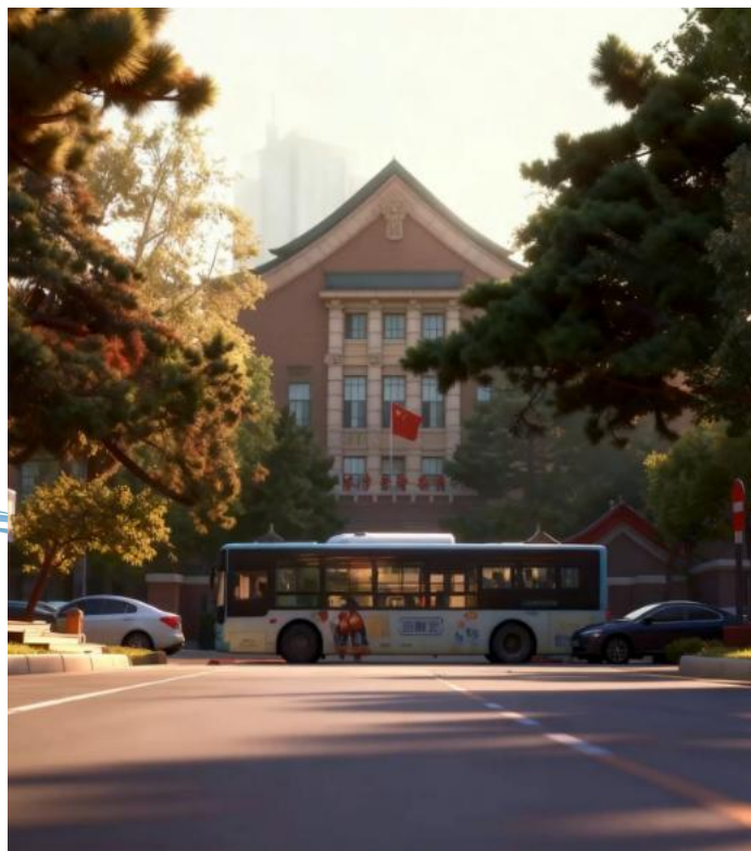
图 3-5 “吉小匠带你游长春”新民大街视频截图