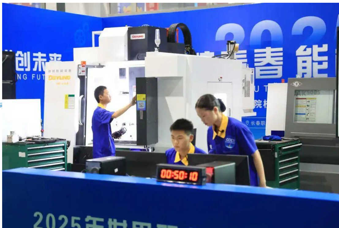
图2-4 世界职业院校技能大赛2

在激烈角逐中，长春市职业院校参赛队伍斩获了 14 金、18 银、21 铜，共计 53 枚奖牌的历史最好成绩，金牌总数占全省的 70%，其中长春汽车职业技术大学、长春职业技术大学、长春机械工业学校的 3 支参赛队伍晋级世赛排位赛，刷新了我市职教学子参加国家级技能大赛的最高纪录。本次大赛不仅全面展示了长春市职业教育高质量发展的丰硕成果，更彰显了我市职教学子的美好素养、精湛技艺。