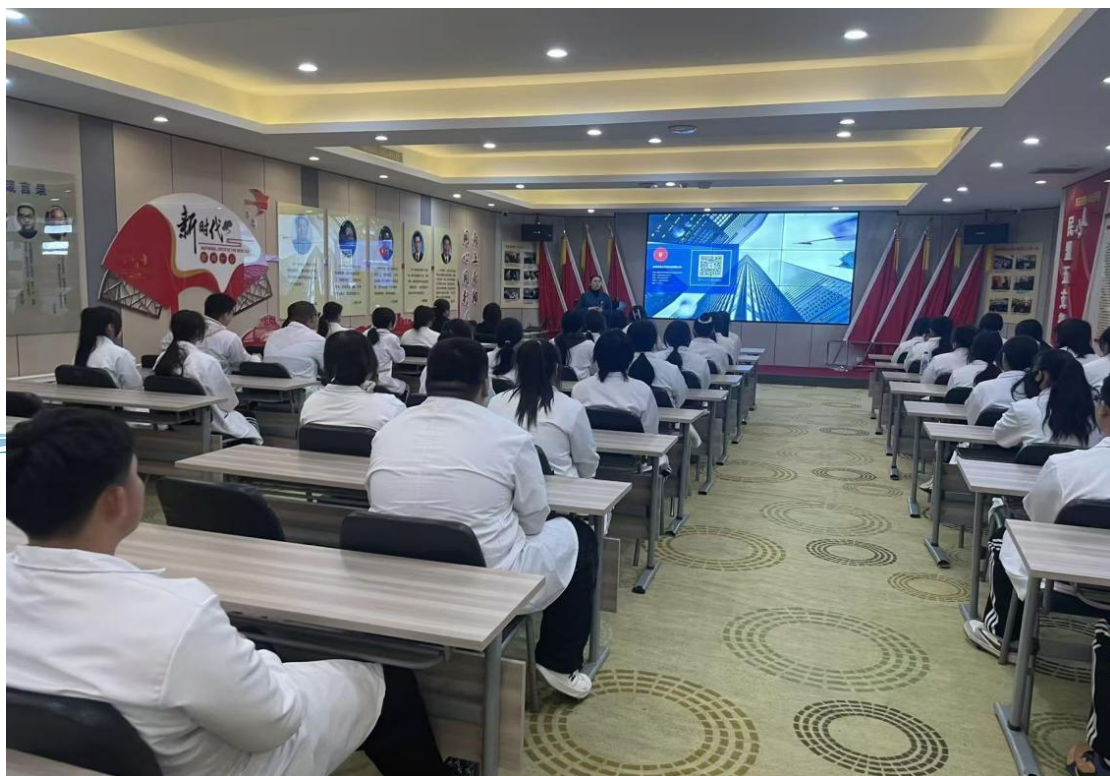
图 6-1 现代学徒制项目师生到企业实践学习