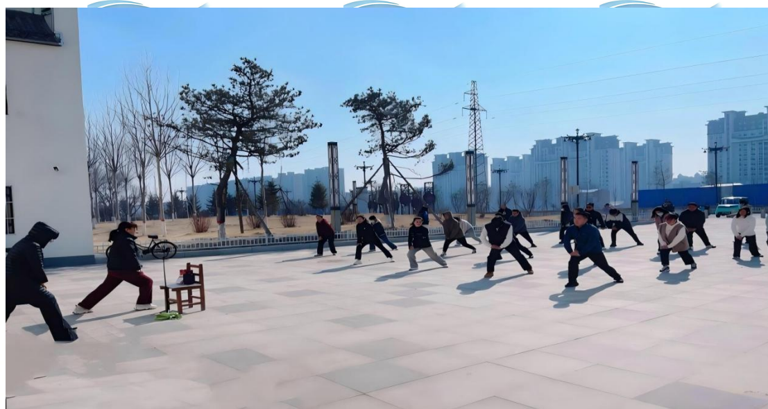
图 3-2 和谐社区关节保健操公益课堂