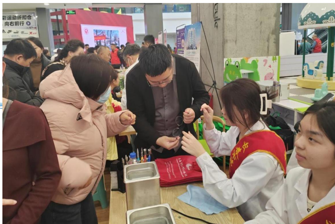
图 3-4 眼视光专业学生为村民清洗眼镜

师生团队依托护理专业，为村民普及心肺复苏、急救包扎等实用技能，增强村民应急救护能力。口腔修复工艺专业师生现场讲解义齿护理知识，引导村民关注口腔健康。眼视光与配镜专业提供免费的眼镜清洗与调整服务，改善村民视觉质量。信息技术专业师生则为村民拍摄并精修证件照，用技术满足日常所需。此外，师生志愿者还积极参与村庄环境美化，清理公共区域小广告，助力改善村容村貌。同时学校还安排新疆籍学生志愿者表演民族舞蹈《石榴花开》，丰富了乡村居民的精神文化生活，增进了民族情感。