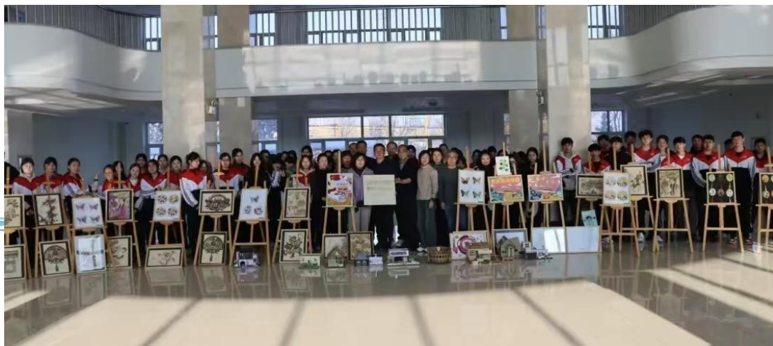
图 4-2 文化展

这一做法为在内地办班过程中促进各民族学生文化交融与情感认同提供了创新范式，找到了“非遗文化”这一既能彰显中华文化共性，又能体现地域民族特性的绝佳教育载体，实现了文化传习、情感联结与生活实践的“三位一体”，让共同体意识培育可知、可感、可亲，形成了一套将文化资源转化为育人资源的系统方法，对各类学校开展沉浸式传统文化教育与民族团结教育具有重要参考意义。