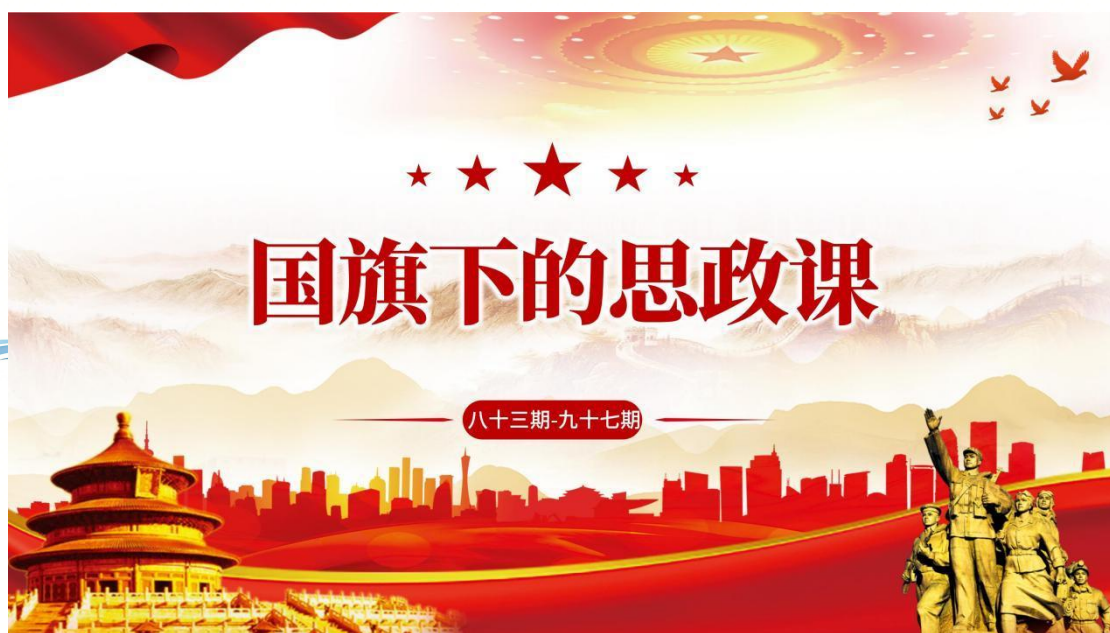
图2-2 国旗下思政课德育品牌