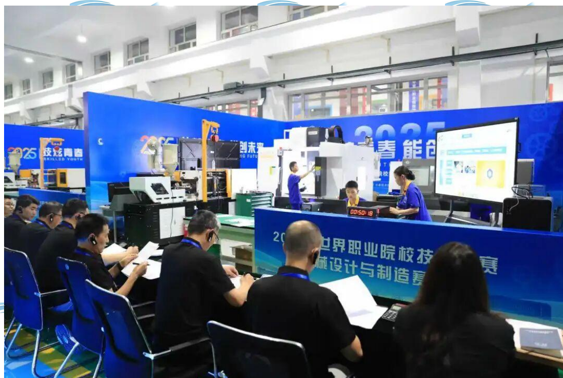
图2-3 世界职业院校技能大赛1

由教育部、国家发改委、人社部等 32 个国家部委联合举办的世界职业院校技能大赛争夺赛（以下简称“世赛”）于 2025 年 8 月—9 月在全国 28 个赛区拉开帷幕。2024 年，世赛由原来的全国职业院校技能大赛升级为国际职业院校技能大赛，目前是我国职业教育领域里层次最高、影响力最大、最具权威性的顶级赛事。