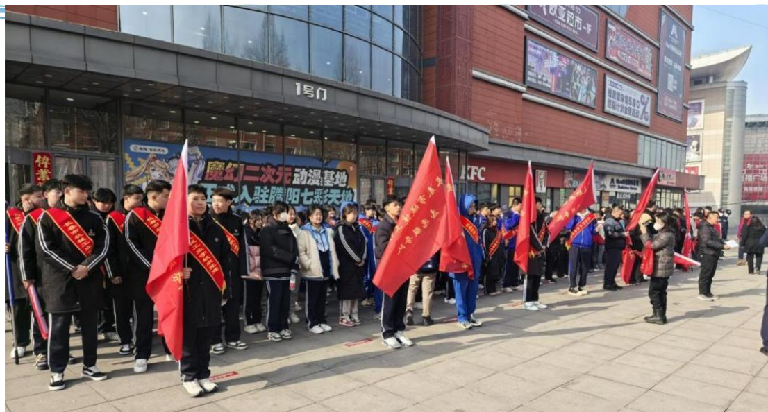
图 3-1 学校学生志愿者开展志愿活动

认领等暖民心行动，通过公益课堂、技能咨询、文化服务等形式，为居民提供装修指导、健康保健、艺术美育、关节保健等服务，惠及广泛群体。开放校内实训场地、体育馆等资源，打造实践性社区教育基地，服务中小学劳动启蒙与全民终身学习需求。